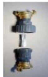
Установка испытательной пластины