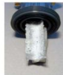
Кристаллизация без FLOSPERSE PX60N